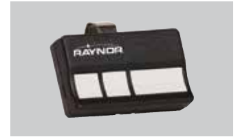
Transmisor de 3 botones